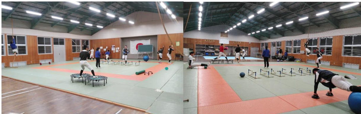
マテリアルトレーニングの様子