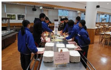
食事はバイキング！

また、食後にはチームミーティングを行い、島根県の秋季大会の決勝のビデオを見ながら自分達との違いはどこなのか、自分達はこれからどこを磨いていけば良いのかなどを考え、新シーズンに向けて、非常に内容のある時間となりました。ミーティングの終盤には、チームメイトと1対1で話す時間を設け、野球や私生活の面でお互いのことをどう思っているのかを評価し合うなど普段はできない活動も出来ました。2年生は今回が最後の冬季合宿で、山口徳地青少年自然の家には学校行事の遠足や、野球部の活動で今回を含め4度宿泊しました。その度に栄養豊富な食事を出して下さり、多くのエネルギーとパワーを蓄えることが出来ました。料理を作ってくださった方はもちろん、施設の職員の方々にいい知らせが出来るよう、これからの野球部の活動をチーム一丸となってやっていきます！